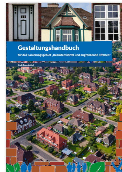
Deckblatt Gestaltungshandbuch © Architektur + Stadtplanung

Das Gestaltungshandbuch soll die Eigentümer und Eigentümerinnen für die städtebauliche und siedlungshistorische Bedeutung des Sanierungsgebietes sensibilisieren und ihnen eine Hilfestellung für eine Gebäudesanierung sein, die auf der einen Seite die Wohnqualität erhöht und auf der anderen Seite dem Wunsch der Stadt Brunsbüttel gerecht wird, das Beamtenviertel und die angrenzenden Bereiche langfristig zu erhalten. Das Gestaltungshandbuch soll zudem einen Beitrag zur Stärkung der Identifikation der Bewohnerinnen und Bewohner mit ihrem Wohnort leisten.